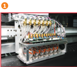
Tiskové hlavy SPECTRA

Tiskové hlavy Spectra zabezpečují vysokou výkonnost a spolehlivost